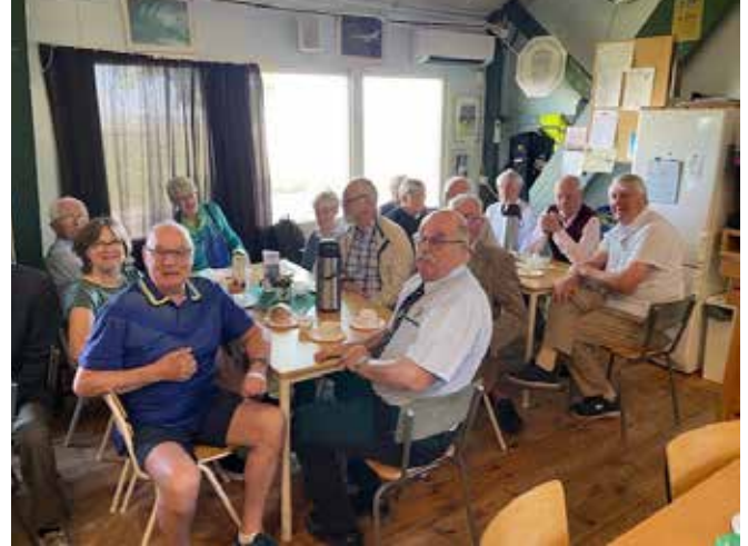
Bilder från besöket

Sveriges flygspaningsmuseum, F11 museum, på Skavsta i Nyköping invigdes 15 oktober 1991, på dagen 50 år efter flottiljens invigning - och 11 år efter dess nedläggning. Under flottiljens glansdagar hade drygt 900 personer sin dagliga gärning på F 11 och cirka 15 000 gjorde sin värnplikt här under åren. Museets föremål och utställningar speglar den nästan 40-åriga F 11-epoken som landets flygspaningsflottilj. Nästan all modern flygspaningsteknik och taktik utvecklades på F 11 i Nyköping under dessa år. I museets byggnader finns spaningsplanen Tunnan, Lansen, Draken och Viggen, två artilleriplan, en framdel av Draken, motorerna till planen, samt smakprov från det mesta inom spaningsflyg. Museet speglar även regionens civilflyghistoria. Alla plan och de fyra simulatorerna har ställts i ordning av museets frivilliga krafter.