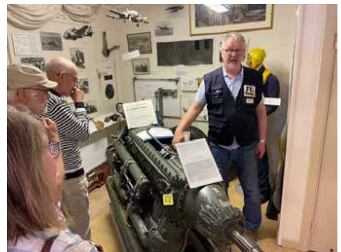
Bilder från besöket