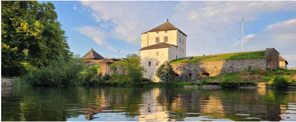
Foto Nyköpingshus.

Nyköpingshus, Nyköpings slott, är ursprungligen en medeltida borg, nu delvis lagd i ruiner. Den är belägen i Nyköping och vissa delar av borgen används av Sörmlands museum för verksamhetens utställningar. Delar av slottet rustades upp på 1900-talet och inrymmer numera Sörmlands museums permanenta utställningar i Kungstornet, samt en restaurangrörelse i Gästabudssalen och Drottningkällaren.