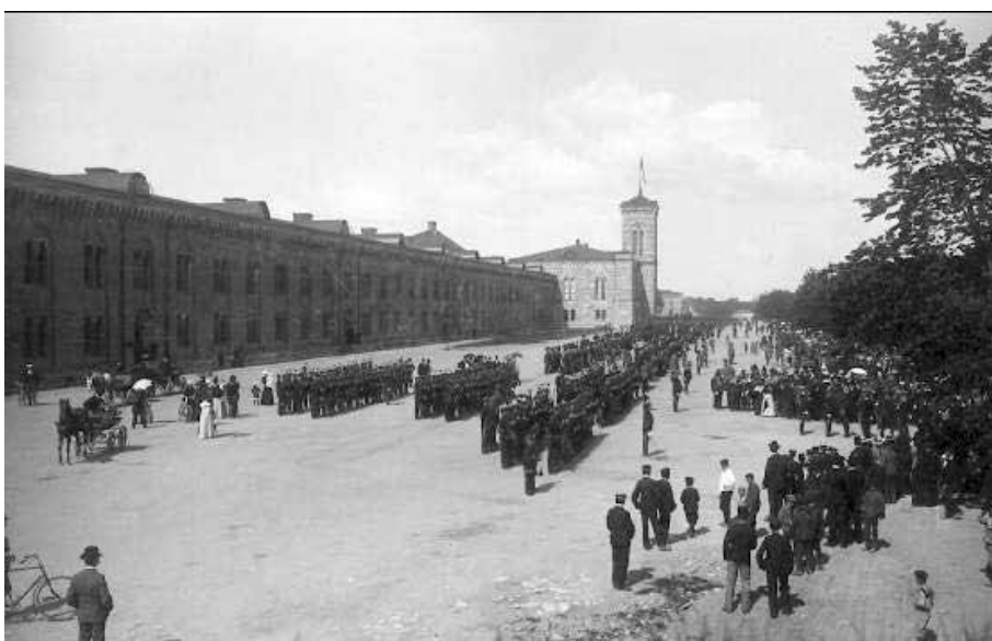
Oscar II inspekterade Göta trängkår år 1898 i Karlsborg.

1891—1902 Göta trängbataljon No 2 1902—1904 Första Göta trängkår 1904—1914 Göta Trängkår 1914—1949 Göta Trängkår T 2 1949—1994 Göta Trängregemente 1994—2000 Göta Trängkår 2000—2007 Göta Trängregemente 2007—2021 Trängregementet 2021—? Göta Trängregemente