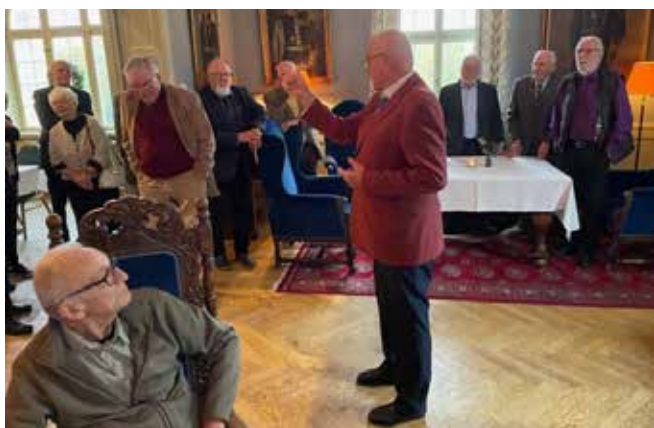
Ordföranden hälsar välkommen.