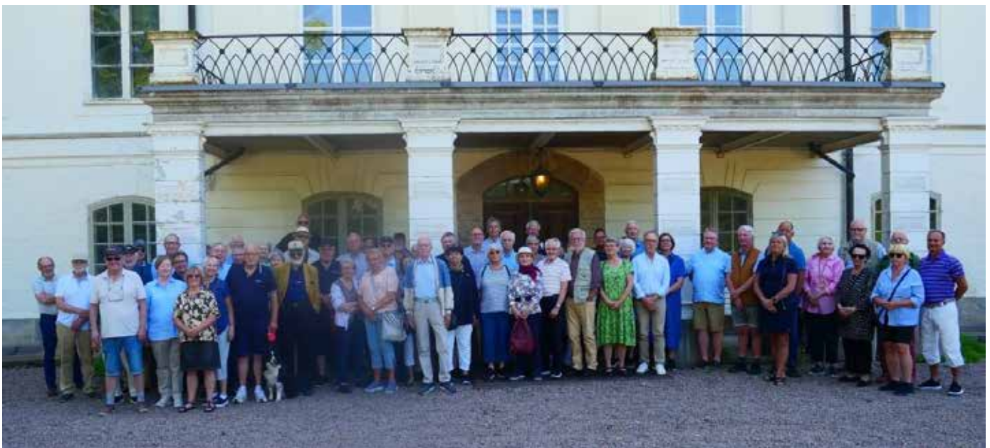
Deltagare i 2024-års trängträff uppställda framför huvudbyggnaden på Almnäs Bruk