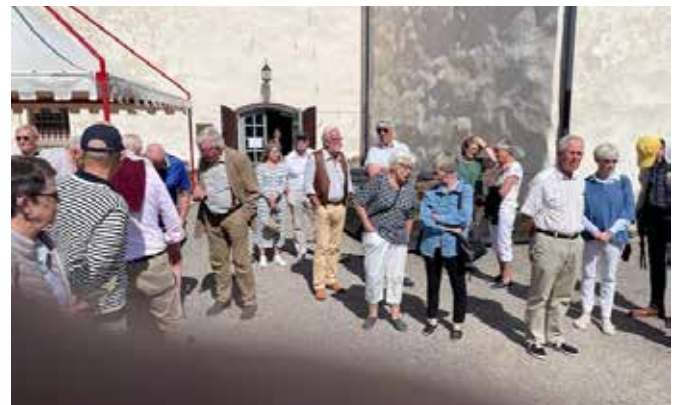
Bilder från besöket med lunchen och guidningen.