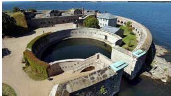
Foto Karlskrona marinbas och flygdag på F17 från allmänna bildmedia.